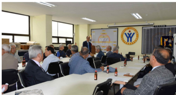
김포 신천공파 지경중회(7월 23일) 내자시 관공중회 등 13개 파중회와 인천중회에서 참석했다. 이날 인순왕후와 8경의 父(諱:綱), 조부(諱:連源), 증조부(諱:順門) 묘역도 참배했다. 90세된 만보 어른도 참석해 자리를 빛냈다.