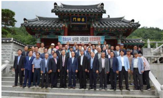
경남 창원 사복시정공파 중회(7월 21일) 일요일도 반납하고 진주, 마산, 함천, 함안, 의령, 산청 등지에서 일가 어른신분들이 모이셨다. 대평 회장은 이날 모임에서 창원 사복시정공파 재실 앞뜰에 금송 한 그루를 기념식수했다.