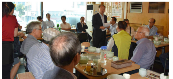
경기 안양 부사공중회(8월 6일) 삼북더위에도 아랑곳하지 않고 강원도 철원중회, 전북 중회, 동서울중회, 경기 안성중회와 수원 안효공묘하 일가들께서 안양에 모여 한마음대회에 큰 관심을 보였다.