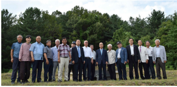
강원도 춘천 신천공파 대선중회(7월 19일) 춘천중회, 원주중회, 신천공파 대선중회가 뭉쳤다. 한마음대회를 계기로 이들 중회들은 더욱 자주 만나기로 했다.