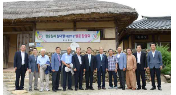
전남 곡성 중회(7월 24일) 곡성에는 조선 중종 38년(1543년) 심광형이 이 지역 유림들과 풍류를 즐기기 위해 지은 함허정(涵虛亭)이라는 정자가 유명하다. 울창한 숲을 배경으로 정자 아래로는 섬진강이 흐르고 멀리 무등산이 보이는 경치 좋은 곳이다.