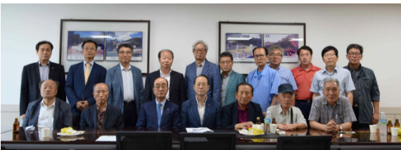
울산 내금위중회(7월 16일) 2018년 1월 현재 야음동 송호마을 청송심씨 세거지에는 청송심씨들이 모여 살고 있다. 울산에는 문중 재실인 갈현재(葛峴齋)와 임진왜란 때 활약한 천재공(泉齋公) 심환(沈渙·1545~1612)을 추모하는 여전당(麗泉堂)이 있다.