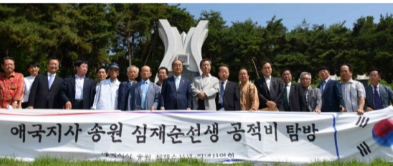
전북 군산 임피중회(7월 7일) 임피중회는 송원 심재순(松園 沈載洵) 애국지사 공적비를 건립해 국가보훈처 현충시설로 지정받았다. 지금은 <애국지사 송원 심재순 선생 기념사업회>가 그 뜻을 이어가고 있다.