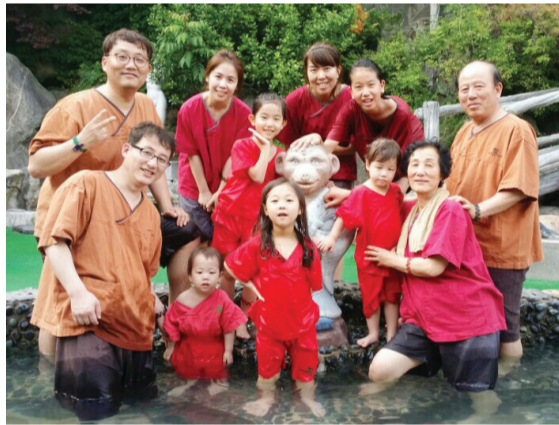
얼마 전 가족 11명이 모두 지리산 온천으로 놀러 가서 찍은 사진.

그뿐 아니다. 대섭 씨는 익산시 석암동에 선산을 갖고 있는데 사진을 보니 금잔디가 기름이 잘잘 흐를 정도로 관리가 일품이다. 두 아들 덕분이다. 큰아