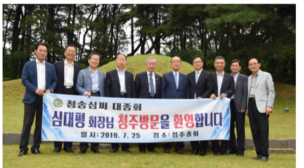
충북 청주중회(7월 25일) 4세조 청성백(諱:德符) 할아버지 배위 청주 宋씨 할머니 묘소 앞에서 대회의 성공을 다짐했다.