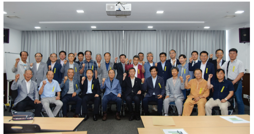
8월 2일 대전역사 회의실에서 있었던 중앙운영위원 위촉식