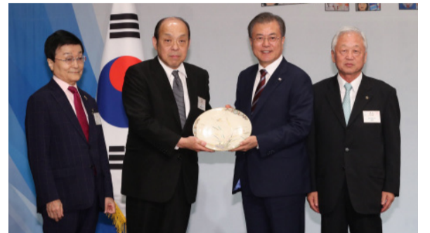
6월 27일 오사카 뉴오타니 호텔에서 열린 동포 만찬에서 제15대 심수관 씨(왼쪽에서 두 번째)가 문재인 대통령에게 사쓰마 난화도(蘭花圖) 접시를 선물하고 있다.

대평 회장은 앞으로 심문의 젊은이들을 가고시마의 심수관 도요(陶窯)에 보낼 테니 잘 교육시켜 달라는 부탁도 했고, 15대 심수관은 흔쾌히 수용했다.