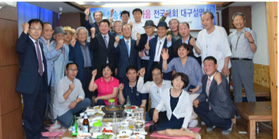
대구중회(7월 2일) 10월 5일 한마음대회 운영위원(100명)은 대구중회 청·장년회가 중심이 된다!