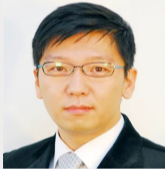
심영재 행정안전부 부이사관(5월 30일)