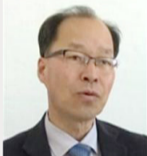
심재균 대구광역시 자치 행정국장(7월 10일)