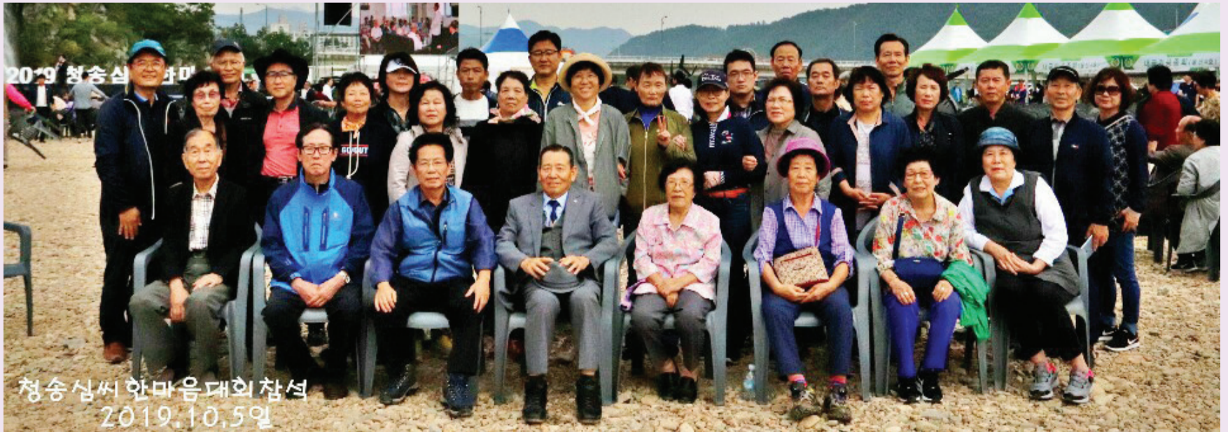
청송심씨 한마음대회 참석 2019.10.5일