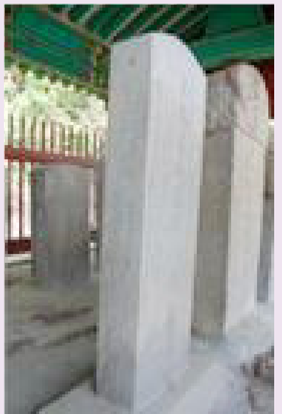
평택시 진위면 능성구씨 송덕비

청령공의 신도비문을 찬술한 대제학 김학진은 “우리나라에서 심 씨보다 나은 씨족은 드물다”고 찬미했다.