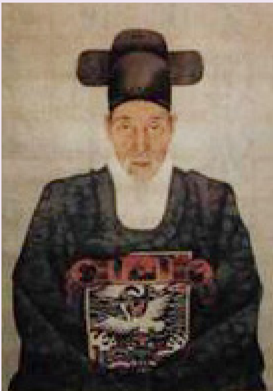
청령공 심순택 초상화

청령공 대훈위 심순택(沈舜澤)선조님은 청송 심문의 마지막 정승이며, 대한제국의 멸망을 끝까지 막으려 한 충신이었다. 대한제국 최초로 '공작(公爵)'의 작위를 받았고, '대훈위(大勳位)'에 녹훈되었다. 1884년 우의정 때 갑신정변이 발생하자 좌의정에 임명되었는데, 하루 만에 다시 영의정에 오른 특이한 이력을 갖고 있다.