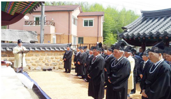
두산정에서 경남종회원들이 향사를 봉행하는 모습.

경남 합천군 삼가면 두모2길7(두모리)에는 청송심씨 2세조 합문지후공(閤門祇侯公 · 휘 淵)의 재실 두산정(杜山亭)이 있고, 산청군 단성면 묵곡리의 청송심씨 재실 만취재(晩翠齋)에는 여섯 현조를 모신 사당 세덕사(世德祠)가 있다. 이 두 곳을 정성껏 관리하고 있는 후손이 경남종회이다.