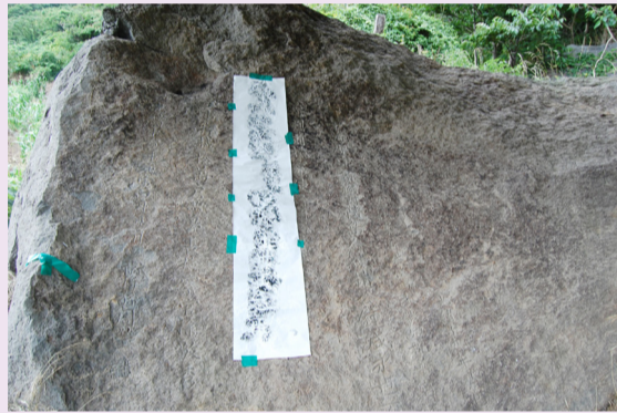
울릉도 태하리에 있는 심순택홀진영세불망대