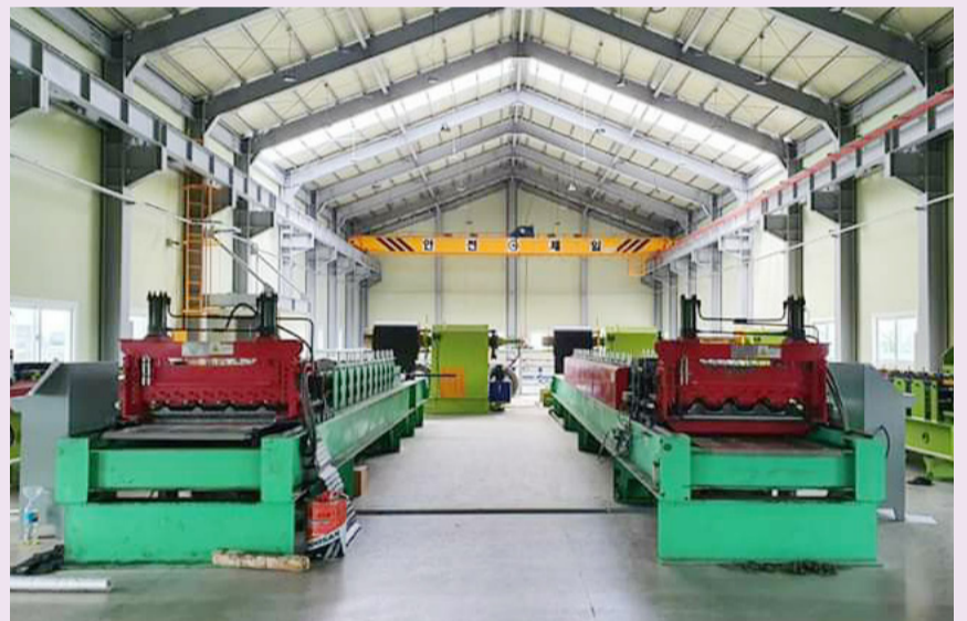
(주)청송스틸의 깨끗한 내부 전경