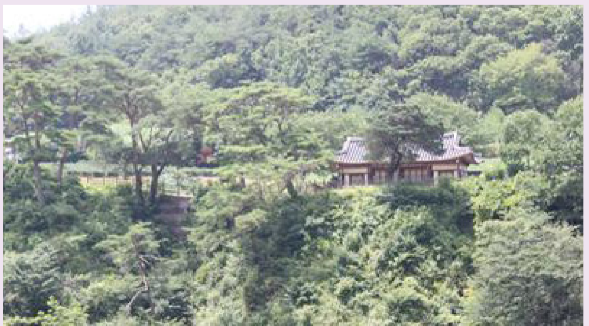
안동에서 청송으로 들어오는 국도 오른쪽 언덕 위에서 있는 벽절정