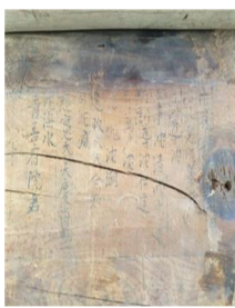
▲ 당시 중건에 참여한 선조들의 이름이 적힌 상량문

그런데 이번에 발견한 상량문에는 중건 시기를 ‘丁巳年(1617년)’으로 표기하고 있어 기존에 알려진 1615년보다 2년이 늦은 것을 알 수 있다.