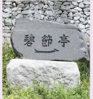
벽절정 입구 표지석

이러한 의로운 기운이 우리 심가의 몸속에 찬연히 흐르고 있는 거야. 우리는 이러한 선조(先祖)의 가르침을 잘 이어받아야 하는 거야. (다음 호에 계속)