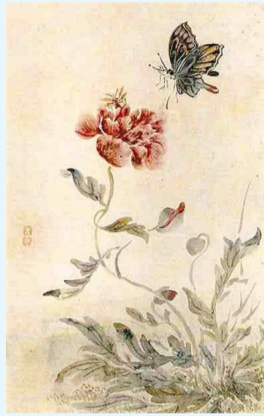
심사정 할아버지가 그린 초충도(草蟲圖)

일찍부터 겸재 정선의 문하에서 그림공부를 했고, 중국의 남화와 북화를 종합한 새로운 화