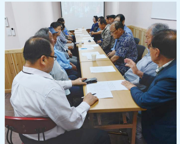
안동종회 이사회 모습

한편, 안동선비문화박물관(전화 054-852-4506)에는 영의정 만사공(휘 지원)과 만사공 증손 한송재공(휘 사주), 재헌공(휘 정진), 전라도관찰사와 내부협관을 지낸 여주공(휘 상익) 등 청송심씨 선조들의 간찰도 여러 점을 전시하고 있다.