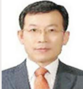
심민명 울산광역시 혁신 산업국장(7월 1일)