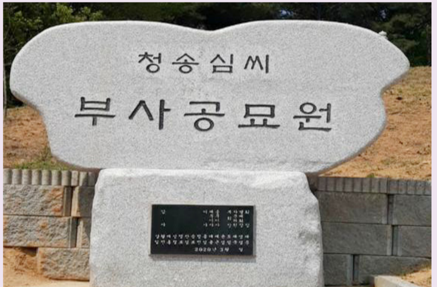
지난 5월 말에 완공한 경기 화성시 팔탄 선산의 부사공묘원