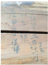
▲ 중건 시기가 적힌 상량문

문헌에 따르면 보광사는 이런 절이다. “7세기 경 신라시대의 명승인 의상대사(義湘大師)가 처음 건립했다고 전해지며, 조선 세종의 비인 청송심씨(淸松沈氏) 소헌왕후(昭憲王后 · 1395~1446)의 시조묘를 모시는 사찰이었다. 극락전(極樂殿)은 세종 11년(1429)에 만세루 등과 함께 처음 건립한 것으로 추정되나, 현재의 건물은 조선 중기에 다시 지은 것으로 보인다. 보수공사 중 만력(萬曆) 43년 12월 1일 자의 상량문이 나왔으므로 1615년 건축으로 여겨진다.”