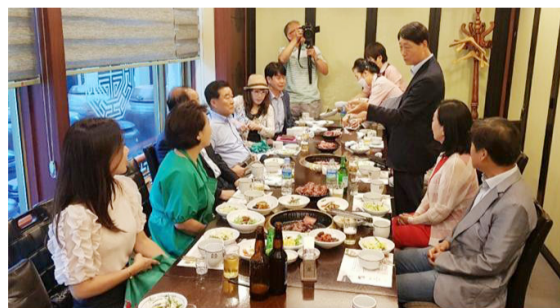
청송심씨우리종회 발족식 장면