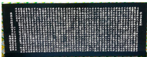
2012년 현액한 두산정 중건기.

문화재로 등록된 후 경상남도의 지원을 받아 2011년 3월 대대적인 보수공사를 마치고 심의조 심경섭 심성섭 심재화를 비롯하여 300여 후손들이 모여 자축했다. 그 사실을 기록한 중건기문은 성균관 부관장을 지내고 현 대중회 부