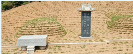
새롭게 단정한 현재 심사정 할아버지 묘역

풍을 이뤄 단원 김홍도와 함께 조선 후기의 대표적인 화가로 평가받는다. 심사정 공은 하루도 쉬지 않고 그림을 그렸던 전문 화가로 산수, 화조, 인물 등 거의 모든 분야에 걸쳐 다양한 작품을 남겼다. 현재 3백여 점이 넘게 남아 있다. 원래 심사정 공의 묘소는 경기도 과천시 광탄면에 있었으나 이곳이 군사보호지역이 되면서 1978년 4월 정부시책에 따라 경기도 용인시 처인구 이동면 서리 산231-3으로 천장했다. 현재 재공 후손들은 그 후 용인을 거점으로 청송심씨 현재공파종회를 만들어 지금에 이르고 있는데 천장한 지 42년이 지나면서 잔디가 죽고 축대가 붕괴할 우려가 있어 올해 윤년해를 맞아 묘역을 정화하고 위안제를 봉행하게 된 것이다.