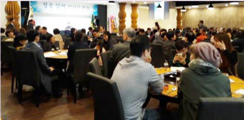
2019년도 총회 장면. 부사공중회는 중사에 참여하는 종원에게 다양한 인센티브를 주고 있다.

부사공중회는 앞으로도 종원들의 좋은 제안을 수렴하고, 이사회에서 끊임없이 정책을 발굴하여 국내 최고의 모범 중회가 되도록 노력하겠다는 각오를 다지고 있다. 또 청송 심문의 위상과 부사공 할아버지의 빛나는 치적에 부응하도록 중회 임무에 더욱 매진하겠다고 한다.