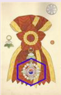
심순택이 최초로 받은(1902) <대훈위이화대수장(大勳位李花大綬章)>

청령공은 안효공(휘:온)의 후예로 온양공(휘:인겸)의 11대손이며 청헌공(휘:택현)의 5대손이다. 조선왕조가 일제에 멸망하기 직전까지 고종의 최측근으로서 국정을 담당했다. 1905년 을사조약으로 국권을 상실하자 조병세와 함께