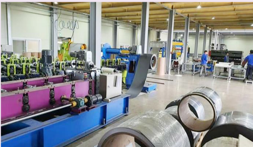
현대화 · 자동화로 탈바꿈한 청송스틸 생산라인

현대의 건축 양식은 빠르고 다양하게 변하면서, 아름다운 외관은 물론이고 경제성과 효율성을 동시에 요구하고 있다. 청송스틸은 이런 시대적 요구에 부응하기 위해 2020년 6월 청송스틸 공장을 준공하고, 오픈 칼라강판 및 건축자재 생산 시스템을 완비했다. 공장의 생산라인을 현대화, 자동화한 것이다. 이를 통해 전국으로 물건으로 보낼 수 있는 체제를 갖추게 된 것이다.