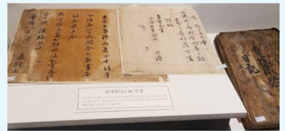
영의정 만사공(휘 지원)의 간찰